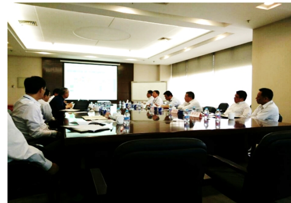
东风公司党委会研究云汽发展问题