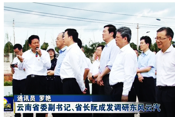
通讯员 罗艳 云南省委副书记、省长阮成发调研东风云汽 省委副书记、省长阮成发调研云汽新工厂