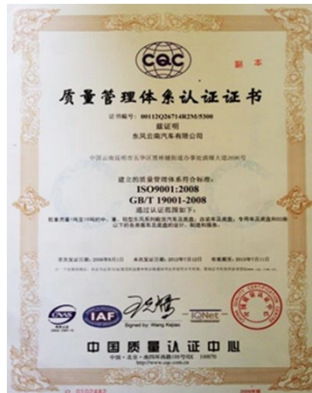
通过ISO9001: 2008 国家质量体系认证