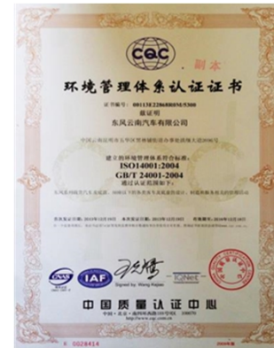
通过国家环境/职业健康安全体系认证