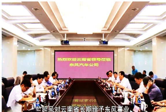
竺延风董事长与云南省领导会谈