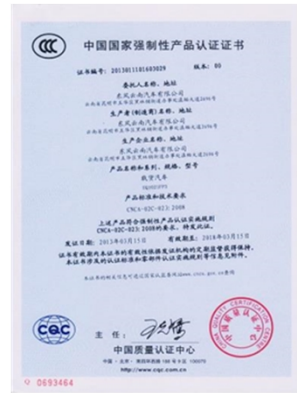
通过国家CQC的 CCC产品体系认证