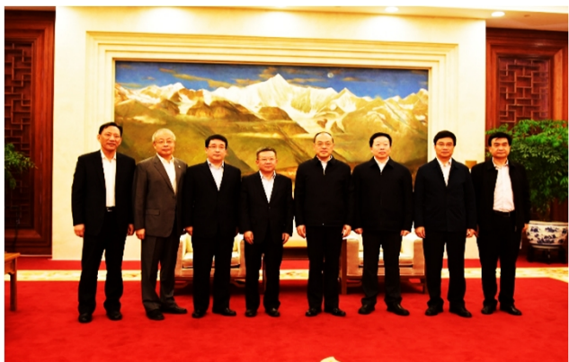
省长阮成发就云汽项目与东风高层会晤

3、领导关怀 与省市区政府及其部门广泛沟通，寻求支持和帮助。目前，政府及各部门对公司支持力度很大，仅社会职能属地化管理与历史遗留问题处理就有18个部门与云汽对接，省委省政府并将公司搬迁升级改造项目列入云南省2017年重点督办项目。