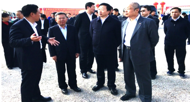
省委常委程连元书记调研云汽新阵地