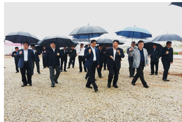
省委书记陈豪等省市领导考察东风云汽