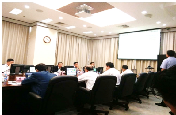
总经理办公会专题研究云汽业务发展方案