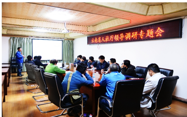
云南省人社厅领导来公司调研服务